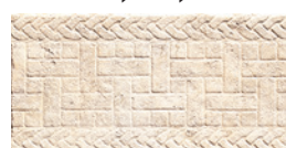
C000365 AVORIO NATURALE