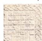
C000368 AVORIO NATURALE