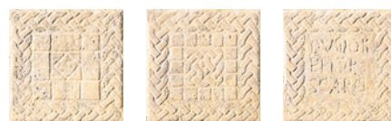
C000423 GIALLO NATURALE