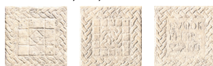
C000425 AVORIO NATURALE