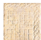
C000366 GIALLO NATURALE