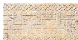
C000363 GIALLO NATURALE