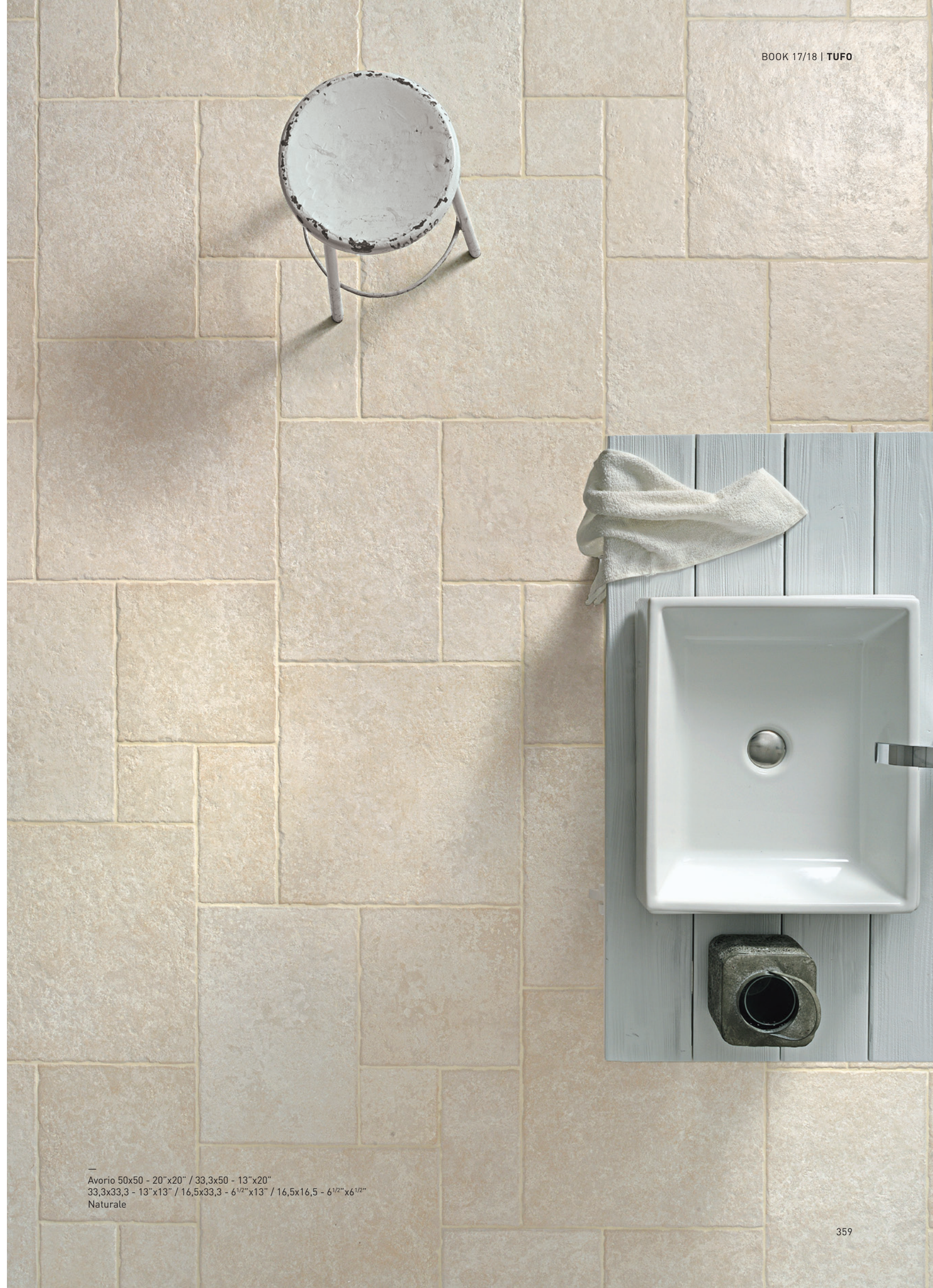
Avorio 50x50 - 20"x20" / 33,3x50 - 13"x20" 33,3x33,3 - 13"x13" / 16,5x33,3 - 6 1/2"x13" / 16,5x16,5 - 6 1/2"x6 1/2" Naturale