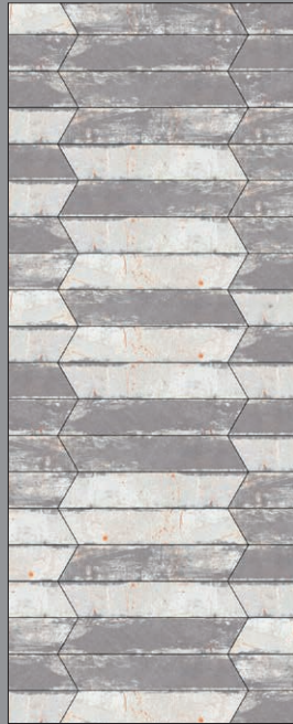
ANTHRACITE A (50%) + B (50%)